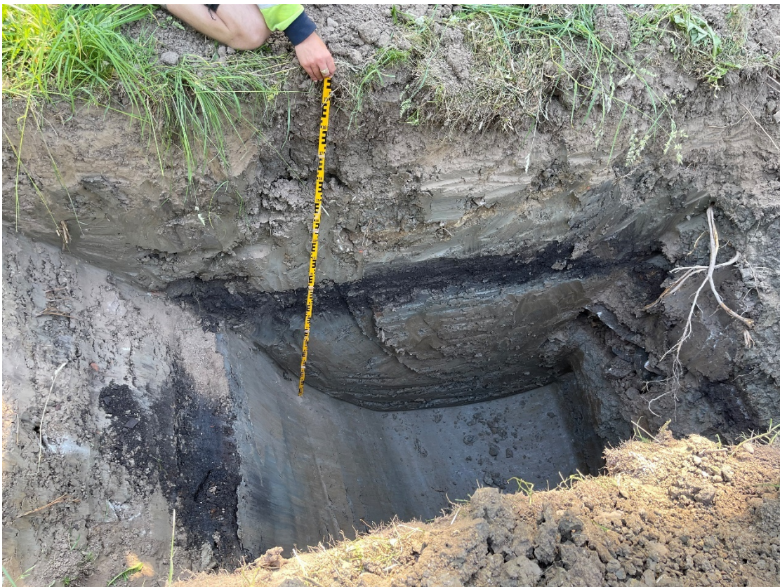
Figur 3. Sektion i schakt 15. Ett påfört lerlager ovanpå ett mörkt raseringslager med 1800-talsfynd, följt av ytterligare påförd lera. Foto mot norr.