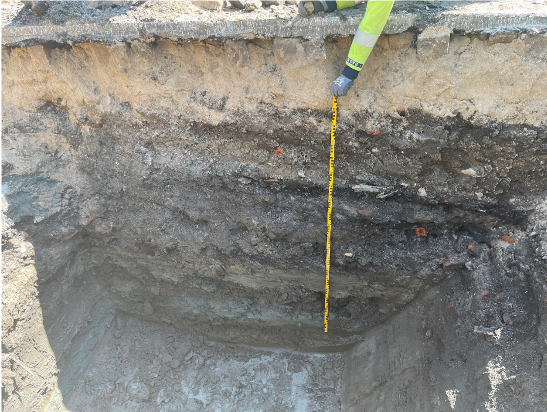
Figur 2. Sektion i schakt 2. Vid +9,20 m.ö.h., under fyllnadsmassorna, framkom kulturlager och påförda lerlager. Foto mot öst.